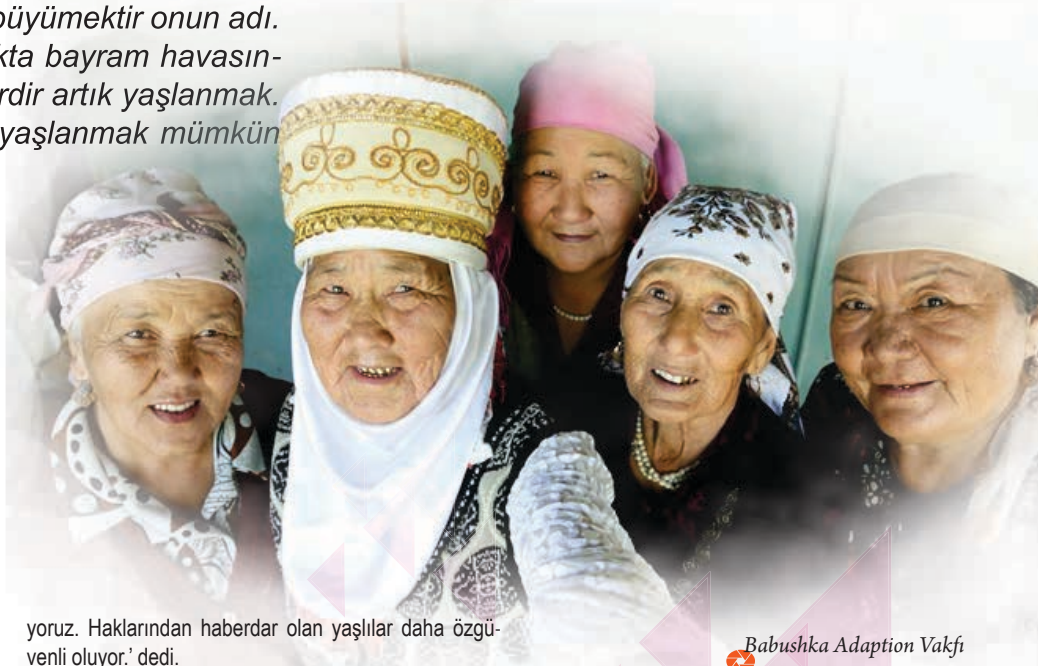
Babushka Adaption Vakfı