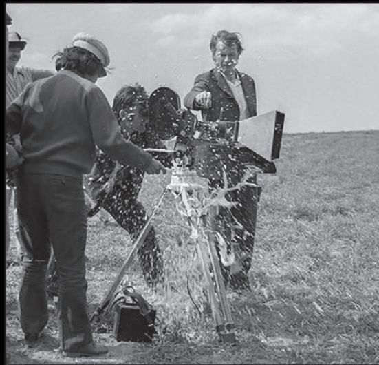
Beyaz Gemi (1975)

Çarli Çaplin film için 'mükemmel bir film' dedi.