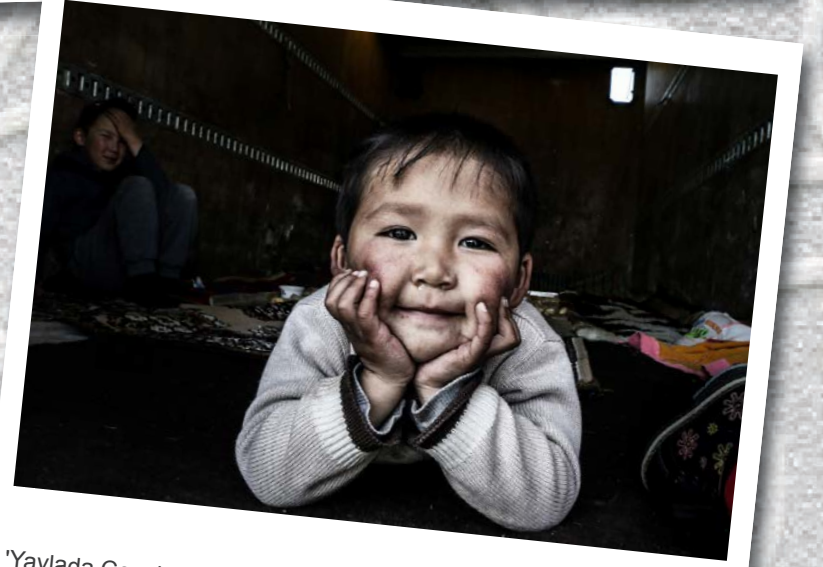
'Yaylada Çocuk Olmak' Narın 2017